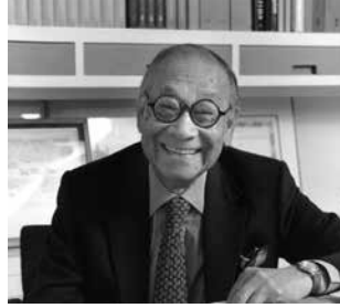
Ieoh Ming Pei 38.