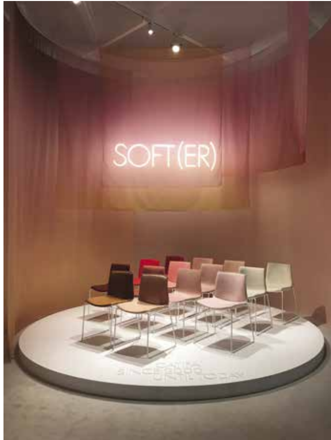
1 Kartell standı, Salone del Mobile. Milano, 2019 (Fotoğraf: Onur Özkoç). 2-3 Arper, "Softer Spaces", Salone del Mobile. Milano, 2019 (Fotoğraf: Onur Özkoç).