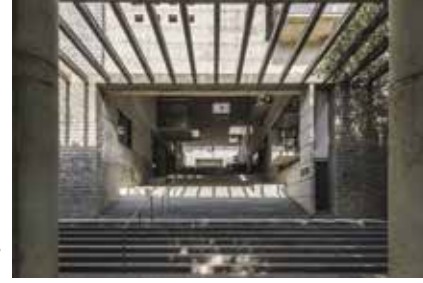
Mindspace Architects 76.