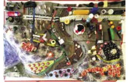
I'MAGE CITY 109.