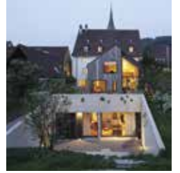
Oppenheim Architecture 86.