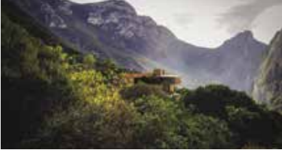
P+0 Arquitectura 96.