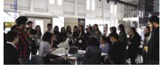
“Atölye 3 Dönüşüm” 40.