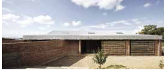
Bella Vista Yatılı Okulu 106.